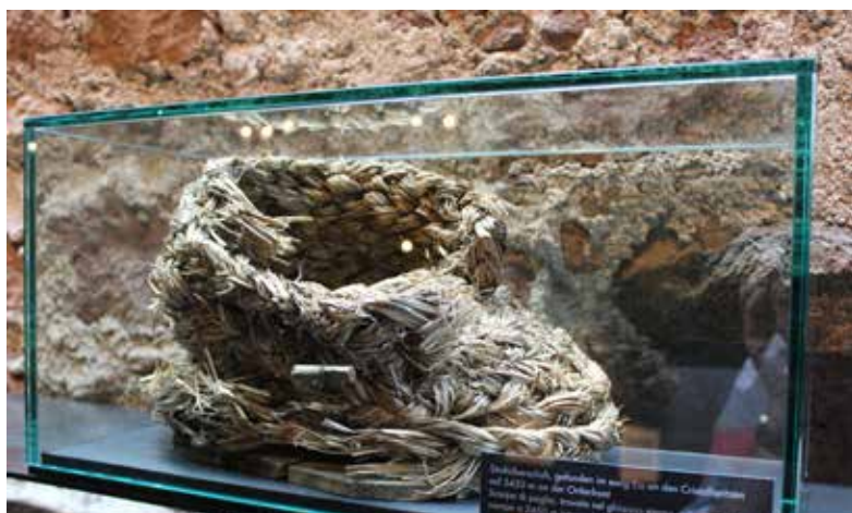
Geïmproviseerde overschoen van stro, gevonden op een hoogte van 3450 m, Ortlerfront