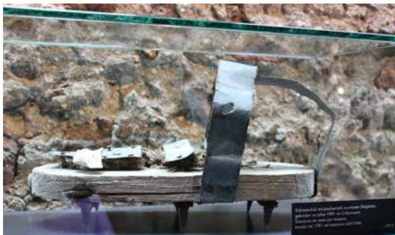
Geïmproviseerde sneeuwschoen met stijgijs, gevonden in 1981 - Ortlermassief