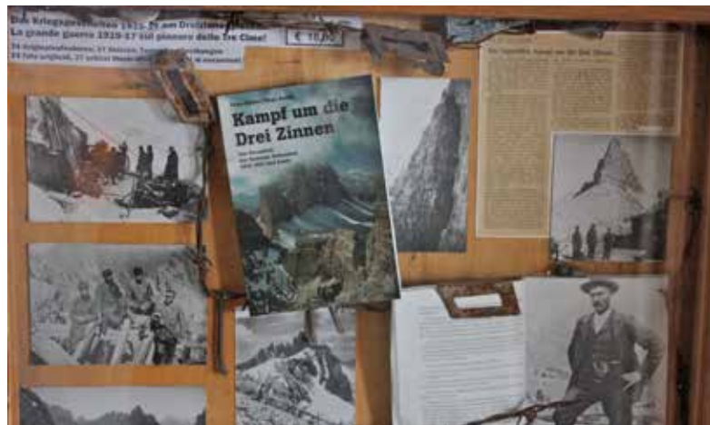
Foto's tonen de moeilijke omstandigheden van de soldaten

Stel dat je met enkele medestanders al weken een kanon bewaakt op de top van bijvoorbeeld de Marmolada. Je raakt naar het einde toe uitgehongerd maar je weet dat er bevoorradingsonderweg is. Die patrouille met nieuwe voorraden wordt inmiddels weggeveegd door een sneeuwlawine. Noch de voorpost, noch de achterhoede weten precies wat er gebeurt. De gevolgen laten zich raden, en dergelijke situaties kwamen voortdurend voor. De zwaarste lawine ging op 28 februari '16 naar beneden ter hoogte van Schluderbach en doodde zowat tweehonderdzestig soldaten. In de zomer was het dan weer de bliksem die ongenadig toesloeg op de kanonnen, de staalkabels of in de munitieopslag.