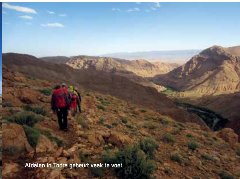
Afdalen in Todra gebeurt vaak te voet