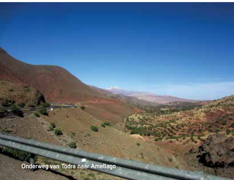
Onderweg van Todra naar Amellago

Niet veel later kwamen we echter opnieuw vast te zitten. De rivier had gewonnen van de weg en niemand durfde nog door het kolkende roodbruine water te rijden. Wachten maar. Na nog eens een uur wilden wij wel onze kans wagen, maar onze chauffeur zag het nog steeds niet zitten. Ik vroeg hem of alles uiteindelijk niet in de handen van Allah lag? Dat bleken de juiste woorden. Inch’Allah en wij terug op weg.