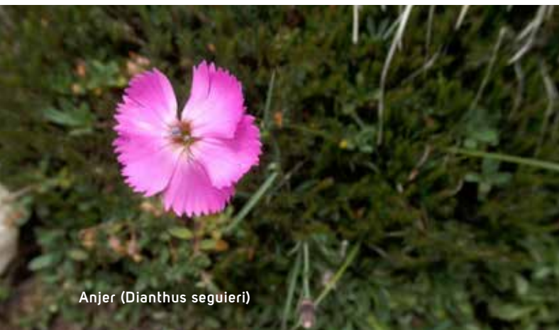
Anjer ( Dianthus seguieri )

Heb onderweg niet alleen oog voor de bloem, maar ook voor haar bladeren: kijk naar hun vorm en hun aanhechting aan de stengel.